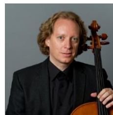
ヴォルフラム・ケッセル