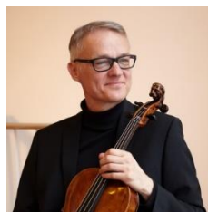
ポール・ペシュティ