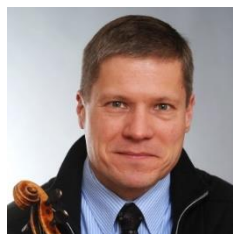
ヘンリック・ホッホシルト